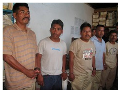
aresztowani członkowie OPIM