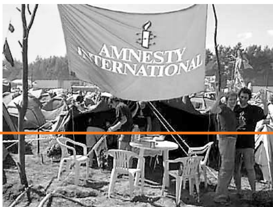
Amnesty na przystanku Woodstock

sprawa, że te narzędzia zbrodni trafiają w ręce morderców, to przede wszystkim lukratywny interes. I nikt nie ma nad nim kontroli. Na świecie jest 639 milionów sztuk broni lekkiej, oznacza to, że na dziesięć osób przypada jedna sztuka broni palnej. Produkuje je ponad 1000 przedsiębiorstw z co najmniej 98 państw