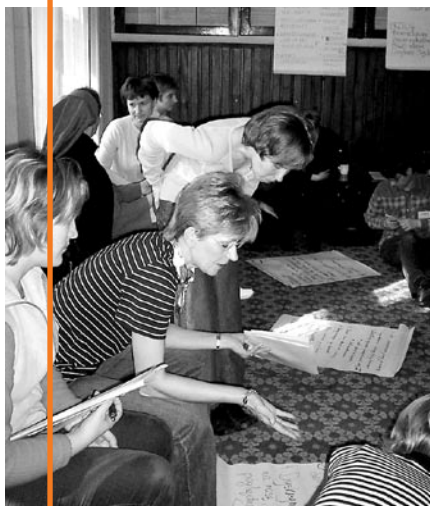
Szkolenie nauczycieli w Krakowie

W 2004 r. we współpracy z Centralnym Ośrodkiem Doskonalenia Nauczycieli w Warszawie przeszkolono kolejną grupę edukatorów i edukatorek Amnesty International. Do 6 głównych regionów, w których prowadzona jest działalność edukacyjna Amnesty International dołączył region dolnośląski. Szkolenia obejmowały wprowadzenie do tematyki praw człowieka oraz międzynarodowego i krajowego systemu ochrony praw człowieka, elementy warsztatów poświęconych przeciwdziałaniu nietolerancji i dyskryminacji, pracy w grupie oraz metodyce nauczania o prawach człowieka. Każda z osób przeszkolonych, posiada stosowny certyfikat uprawniający do prowadzenia edukacji o prawach człowieka dla Amnesty International oraz certyfikat ukończenia formy doskonalenia zawodowego Centralnego Ośrodka Doskonalenia Nauczycieli w Warszawie.