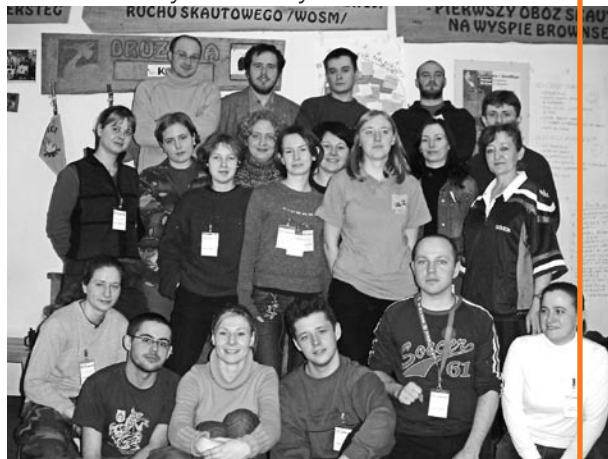
Szkolenie harcerzy ZHP w Olsztynku

W ramach współpracy ze Związkiem Harcerstwa Polskiego powstała harcerska sieć liderów praw człowieka.