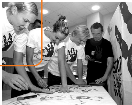
Drużyna polskich siatkarek wspiera kampanię „Stop przemocy wobec kobiet”