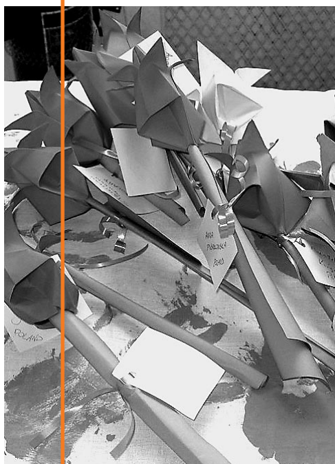
Tulipanowe petycje