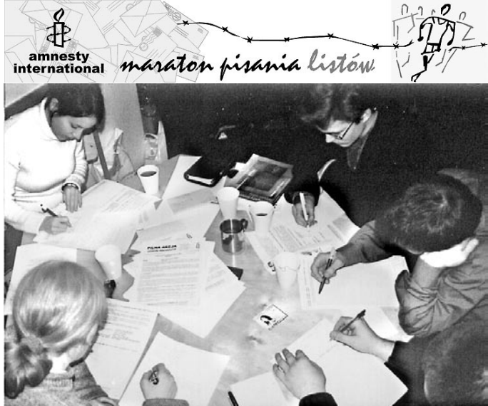
Maraton Pisania Listów w Katowicach

W ramach sieci Pilnych Akcji tysiące sympatyków i sympatyczek AI wysłały listy do władz wielu krajów w odpowiedzi na konkretne przypadki łamania praw człowieka. Z inicjatywy polskiej sekcji AI odbyła się V już edycja Międzynarodowego Maratonu Pisania Listów. Przez 24 godziny w 30 miastach w Polsce i 30 krajach na świecie napisano ponad 60 tysięcy listów! Dzięki takim listom w 2004 roku zwolniono 107 więźniów, wstrzymano wykonanie 16 egzekucji, zniesiono 11 wyroków śmierci, a rodziny i bliscy ofiar otrzymały wyrazy solidarności z całego świata.