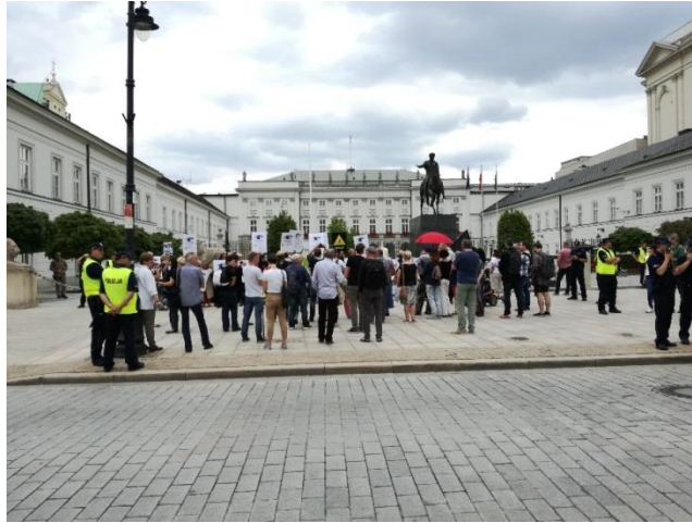
Godz. 13:05 – około 60 osób (Stowarzyszenie Demokratyczna RP i Stowarzyszenie Obywatele Solidarnie w Akcji)