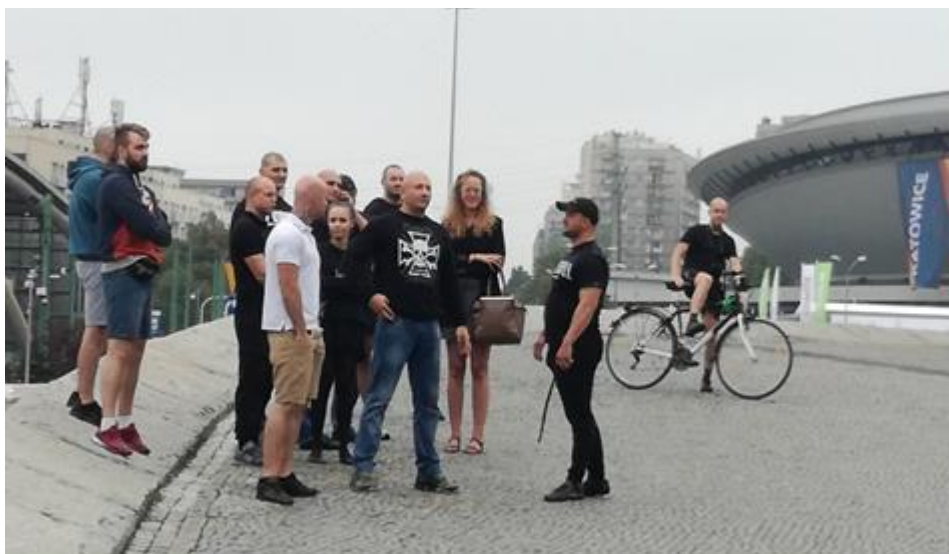
Kontrdemonstracja I, godz. 16:42

Kontrdemonstranci sporadycznie wykrzykiwali wulgaryzmy w stronę uczestników zgromadzenia głównego, m.in. „Co macie kutasy do zaoferowania?”; „Jebać antife!”; „Wypierdalać!”. Widoczna była flaga Konfederacji.