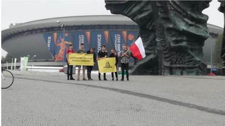
Kontrdemonstracja II, godz. 16:41