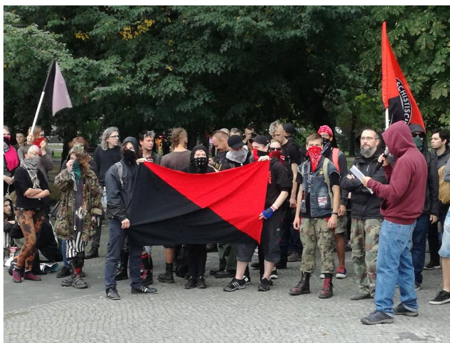
Uczestnicy zgromadzenia, godz. 16:51

Kilkunastu uczestników zgromadzenia miało częściowo lub całkowicie zasłonięte twarze (czarno-czerwone chustki zakrywające nos i usta, kaptury, okulary przeciwsłoneczne, jedna kominiarka).