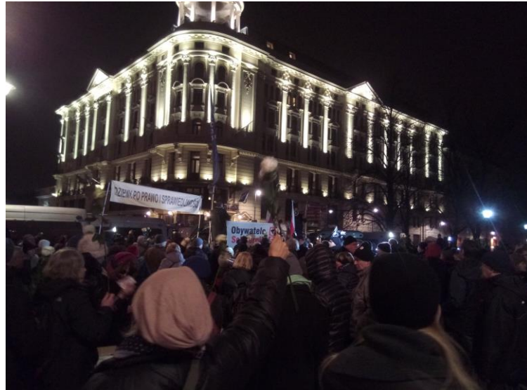
Zdjęcie: uczestnicy zgromadzenia OSA, widok na hotel Bristol, godz. 21:11

21:30 na ul. Bednarskiej zgromadzeni rozeszli się, po otrzymaniu informacji o wypuszczeniu 6 zatrzymanych.