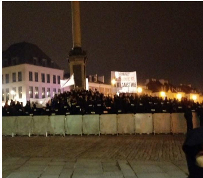
Zdjęcie: zgromadzenie Obywateli RP, godz. 20:13

Obserwatorzy nie usłyszeli formalnego rozwiązania zgromadzenia. O godz. 20:37 uczestnicy zgromadzenia rozeszli się, większość udała się w kierunku zgromadzenia OSA na rogu ul. Karowej i ul. Krakowskie Przedmieście.