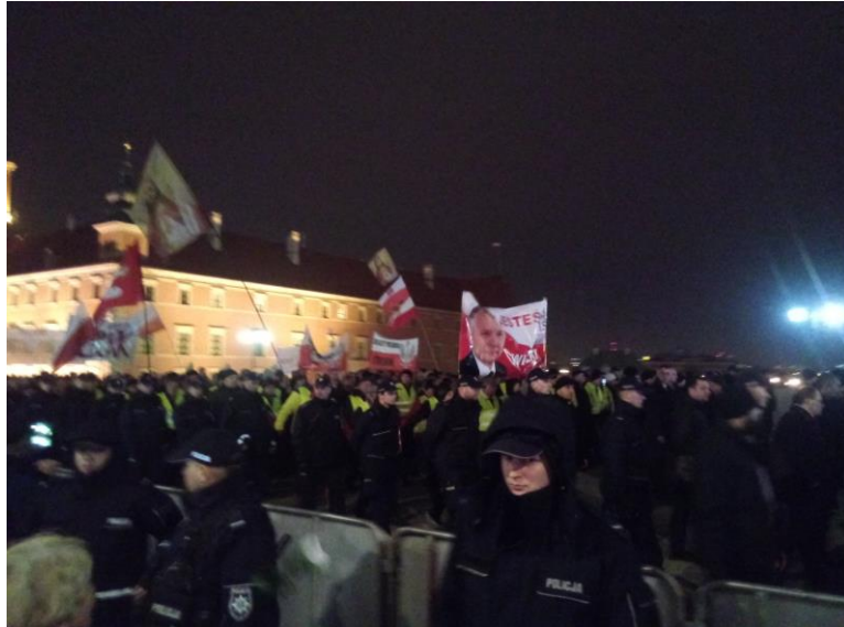
Zdjęcie: uczestnicy zgromadzenia cyklicznego przy wejściu na Krakowskie Przedmieście, godz. 20:32