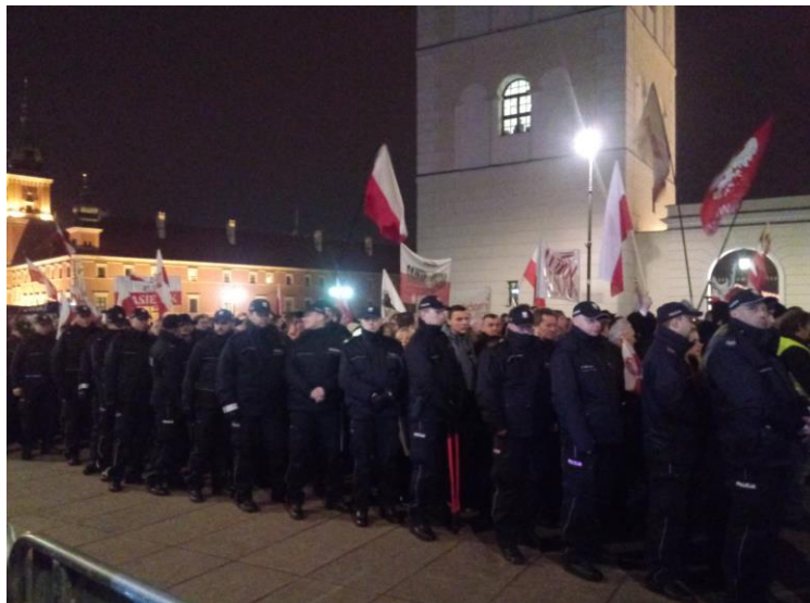
Zdjęcie: uczestnicy zgromadzenia cyklicznego przy kościele św. Anny, godz. 20.34