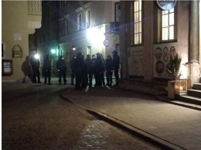
Zdjęcie: blokada przy ul. Jezuickiej, godz. 19:18