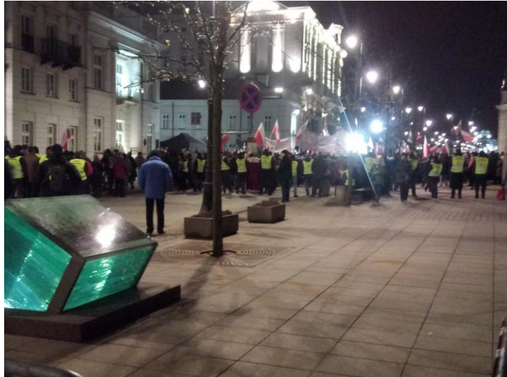
Zdjęcie: tyły zgromadzenia cyklicznego przy kościele Wniebowzięcia NMP, godz. 20:54