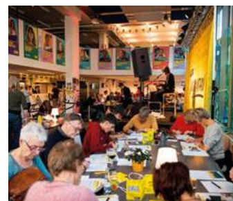
Maraton Pisania Listów w Antwerpii, Belgia, rok 2022.

Przeczytaj o ludziach, dla których walczyliśmy: https://maraton.amnesty.org.pl/